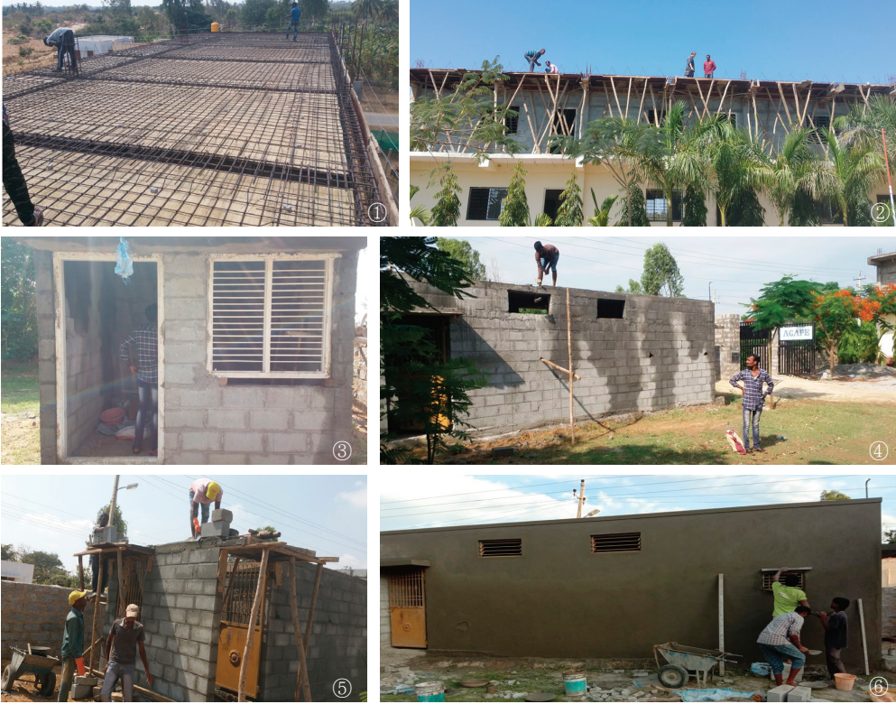
아가페 학교 건축 보고