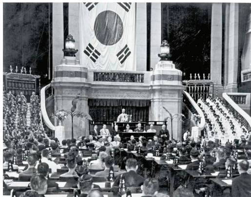
▲ 1948년 5월 31일, 대한민국 최초의 국회의원 제헌국회의 시작

민족사에 길이 남을 소중한 순간, 이들의 신앙 고백을 통해 대한민국 국회는 '기도로 시작한 국회'가 되었고, 이 사건은 이 나라가 기도로 세워